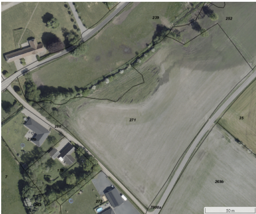
Figur 2: Luftfoto taget i foråret 2024, som viser at matriklen fortsat anvendes i drift, hvor den omlægges (NetGIS).