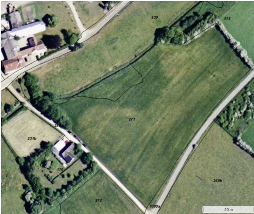
Figur 1: Luftfoto taget i 2004, som viser at matriklen blev anvendt til høslæt (NetGIS).