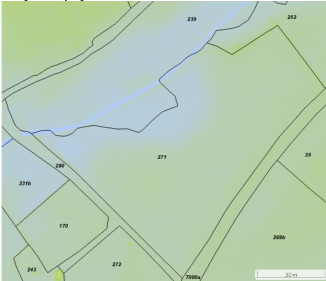
Figur 5: Topografisk kort, hvor blå indikerer lavere terræn og grøn indikerer højere terræn (NetGIS).