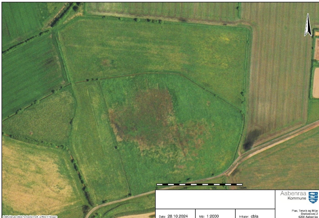
Luftfoto 1999: Vandhullet ikke er etableret endnu (NetGIS).