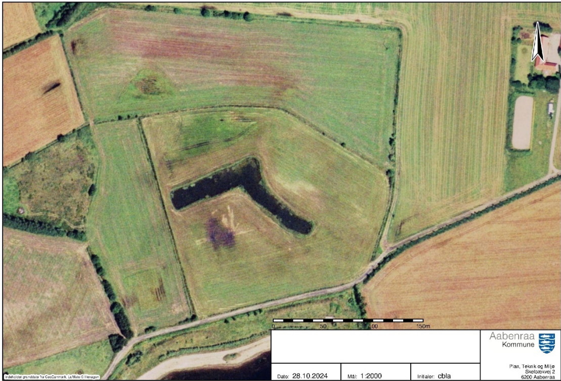
Luftfoto 2002: Vandhullet er blevet etableret (NetGIS)