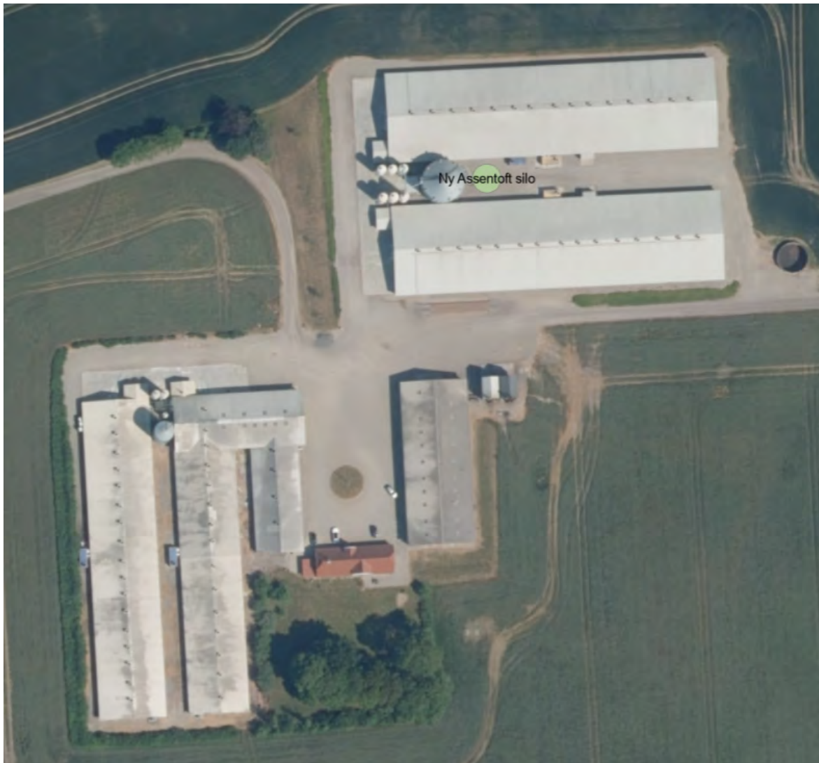
Figur 1. Siloens placering (grøn markering) i forhold til eksisterende bygninger.

Ejendommen ligger i landzone, ca. 700 meter fra Tråsbøl. Landskabet er karakteriseret ved dyrkede marker, læhegn, store og middelstore gårde samt små husmandssteder langs vejene. Området er i Aabenraa Kommunes kommuneplan udpeget som særligt værdifuldt landbrugsområde, hvor landbrugserhvervet har høj prioritet. Ejendommen er ikke beliggende inden for bygge- og beskyttelseslinjer.