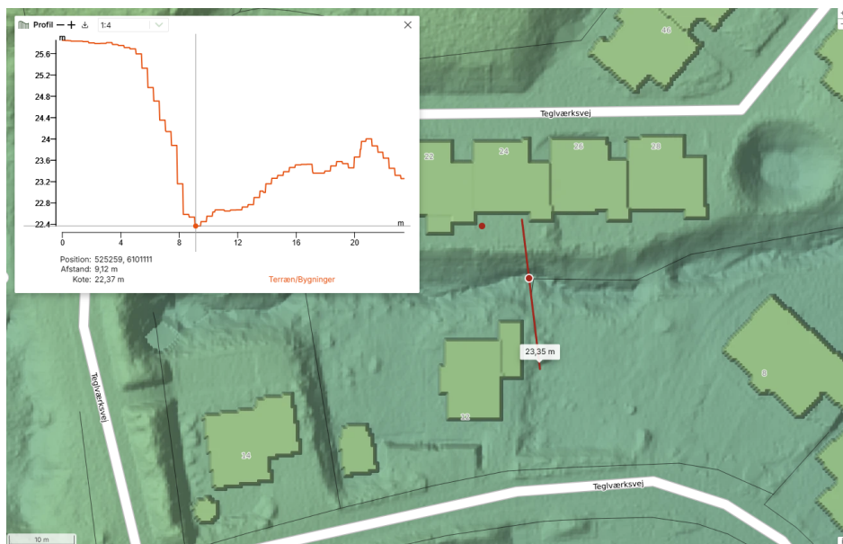
Figur 1: Højdemodel af projektområdet. Det ses at skråningsanlægget på den nordlige brink er stejlt, hvilket kan øge risikoen for erosion i forbindelse med høje vandføringer i vandløbet.

sandede partier. Den sydlige brink er beplantet med store træer, hvilket giver rødder i vandløbet samt skygge. Vandløbet er fortrinsvis grødefrit.