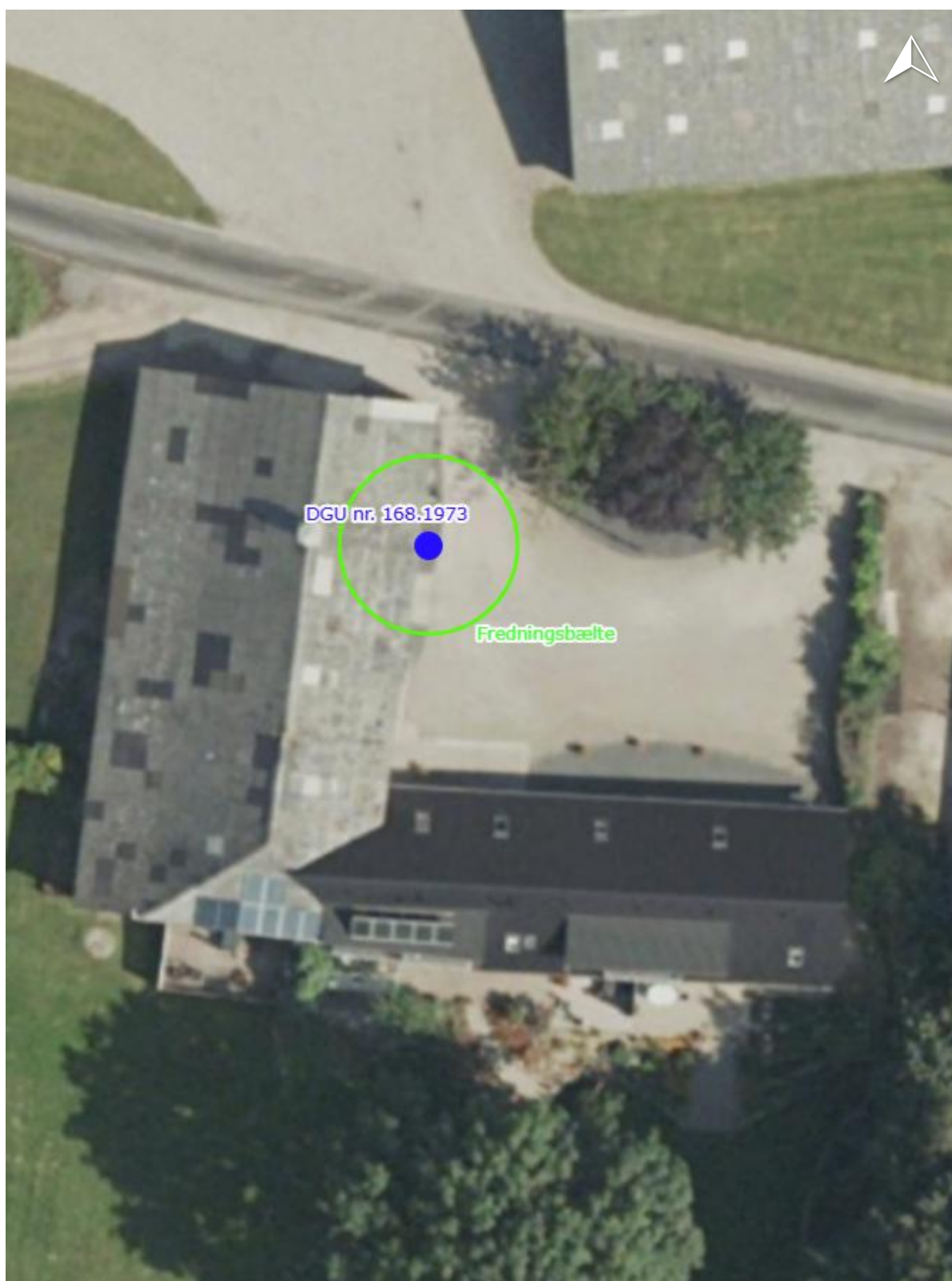
Figur 1: På luftfotoet er placering af boring med DGU nr. 168.1973 angivet med blå prik og fredningsbælte med grøn ring.