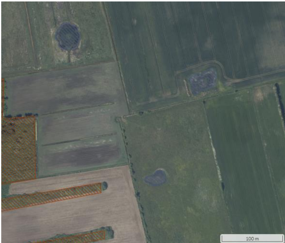
Figur 5: Oversigtskort der viser § 3 beskyttede naturtyper i nærheden af den ansøgte sø (NetGIS).