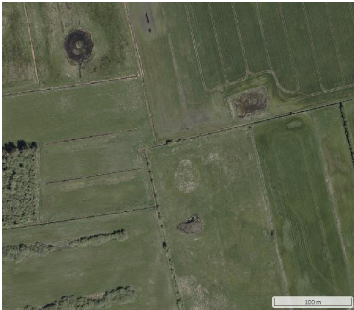
Figur 3: Luftfoto fra foråret 2024, som viser de drænkanaler, som er blevet gravet siden 2018.