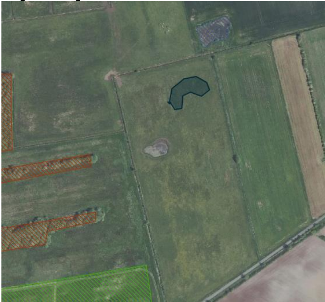
Figur 4: Kort fra ansøgningsmaterialet, der viser udformning og placeringen af den ansøgte sø.