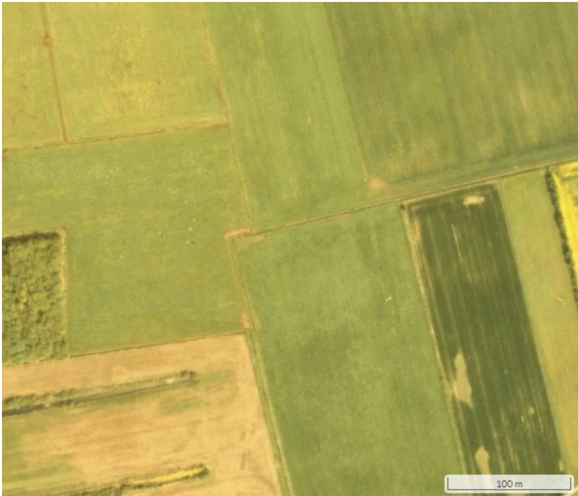
Figur 1: Luftfoto fra 1993, der viser at matriklen har været afgræsset. Den mørke mark i øst har sprøjtespor og eller er der taget høslæt på en del af marker.