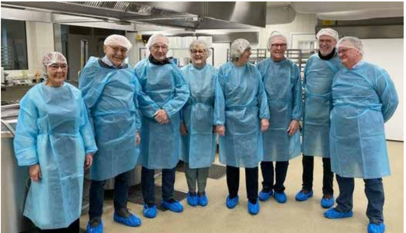
Seniorrådet er klar til at se nærmere på fremstillingen af ældremad.