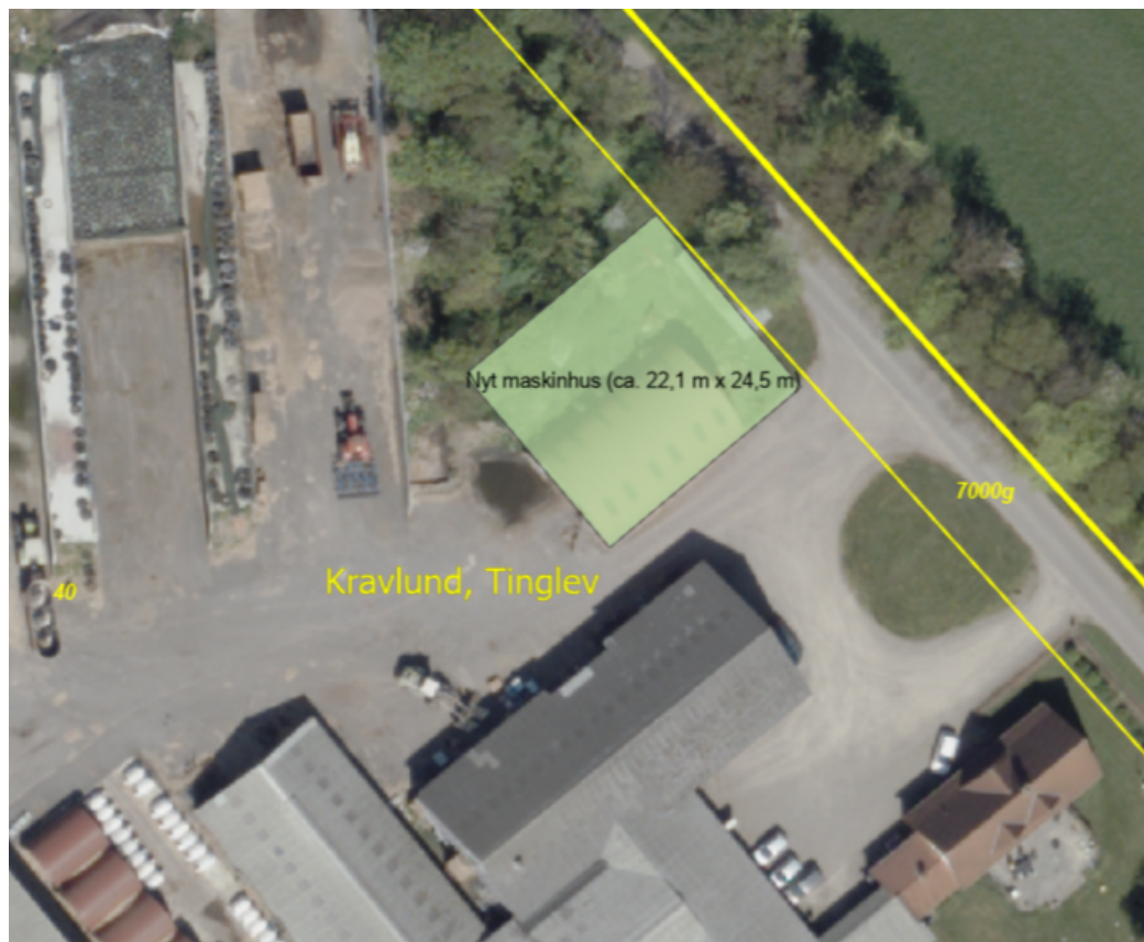
Figur 1. Maskinhusets placering.

beplantning. Maskinhuset vil således kun være synlig på en kort strækning langs Gerrebækvej ved forbigørsel. Byggestilen og ensartetheden videreføres så vidt muligt i det nye byggeri, så det harmonerer med de øvrige bygninger på ejendommen. Aabenraa Kommune vurderer, at maskinhuset vil kunne integreres i landskabet, uden væsentlig visuel ændring af områdets karakter, samt at det samlede bygningsanlæg vil fremstå som én samlet enhed.