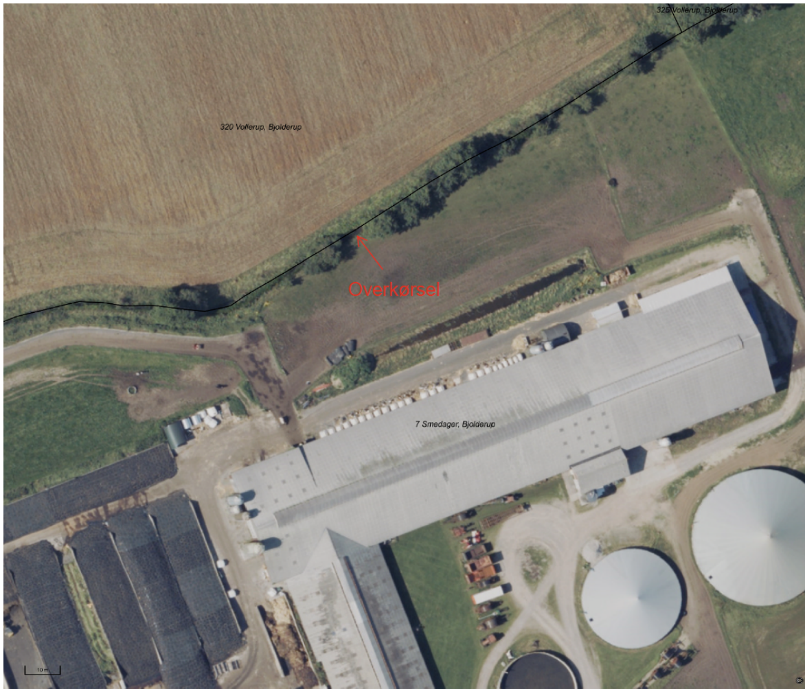
Figur 1: Oversigtskort med anvisning af ny overkørsel.