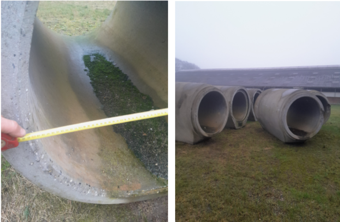
Figur 2: Billeder af de rør, som påtænkes brugt til overkørsel.

Der er flere grunde til at ansøger gerne vil have den ny overkørsel på det pågældende sted: