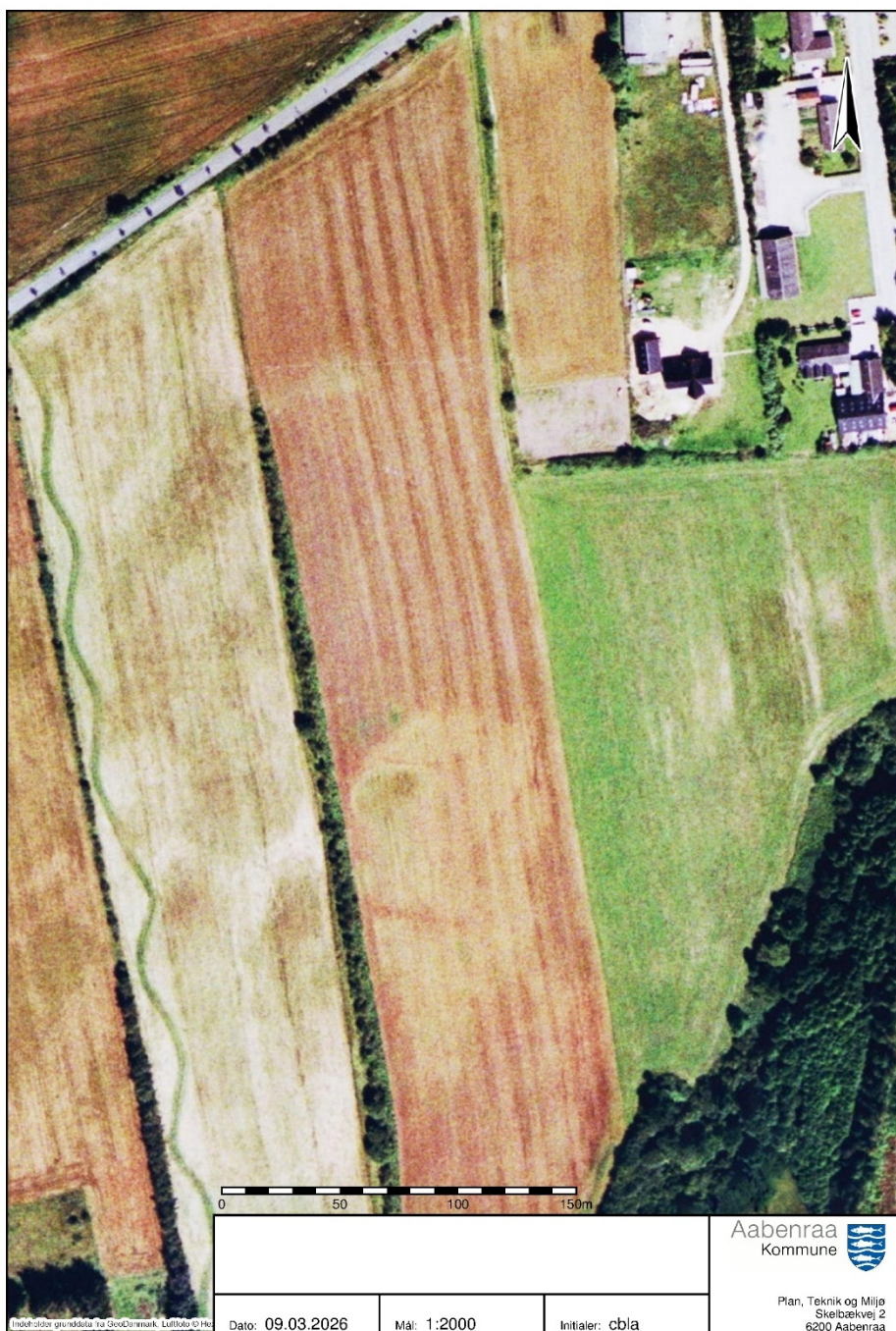
Luftfoto (2002): Arealet er stadig i omdrift (NetGIS).