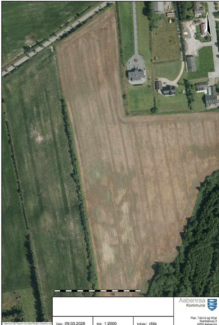
Luftfoto (2012): Arealet er stadig i omdrift (NetGIS).