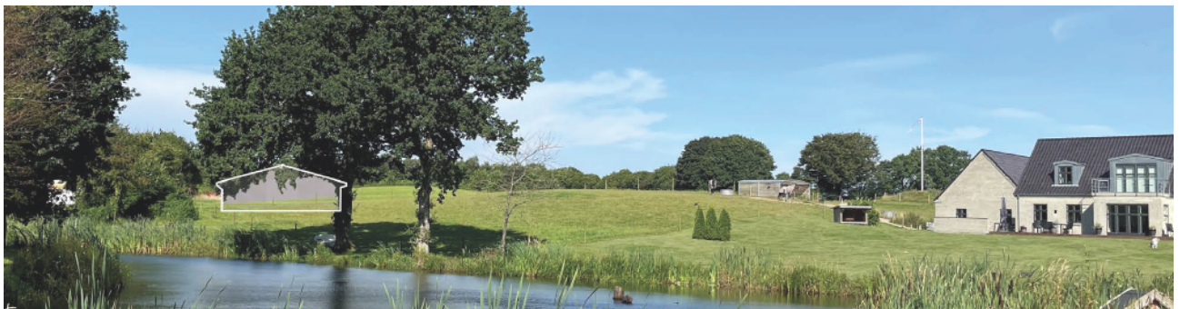
Visualisering af ny bygning (hvid ramme med grå flade) sammen med eksisterende bebyggelse til højre