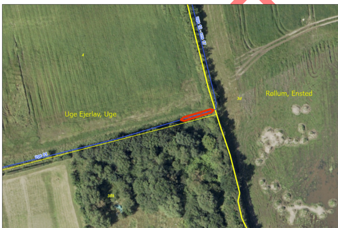
Figur 1: Oversigtskort. Rød skravering markerer omtrentlig etablering af sandfanget.

Sandfanget placeres lige efter det 90 graders sving, hvor Skovvandløbet (uge 12 - ens 17) bliver til Kastvrå vandløb (uge 01). Den omtrentlige placering og dimension er angivet på nedenstående oversigtskort.