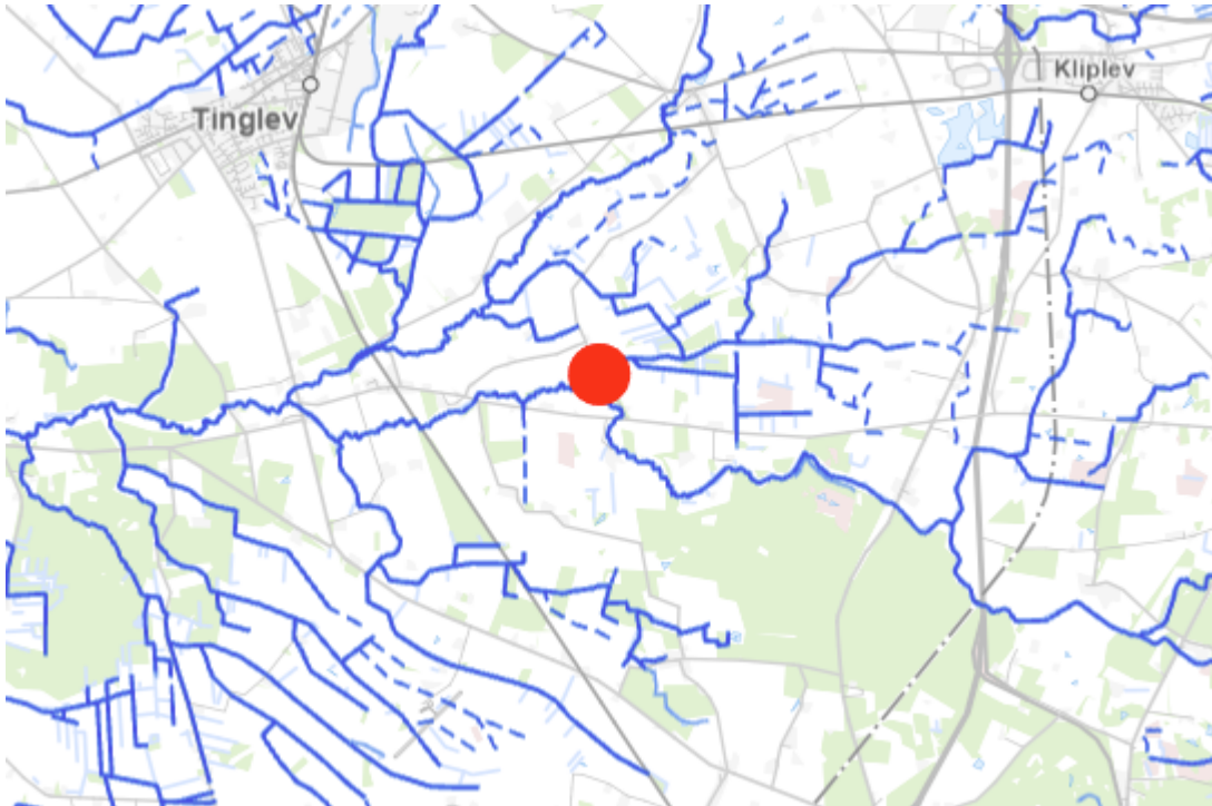
Figur 1: Oversigtskort