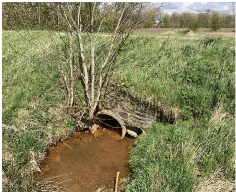
Figur 3: Vest facade