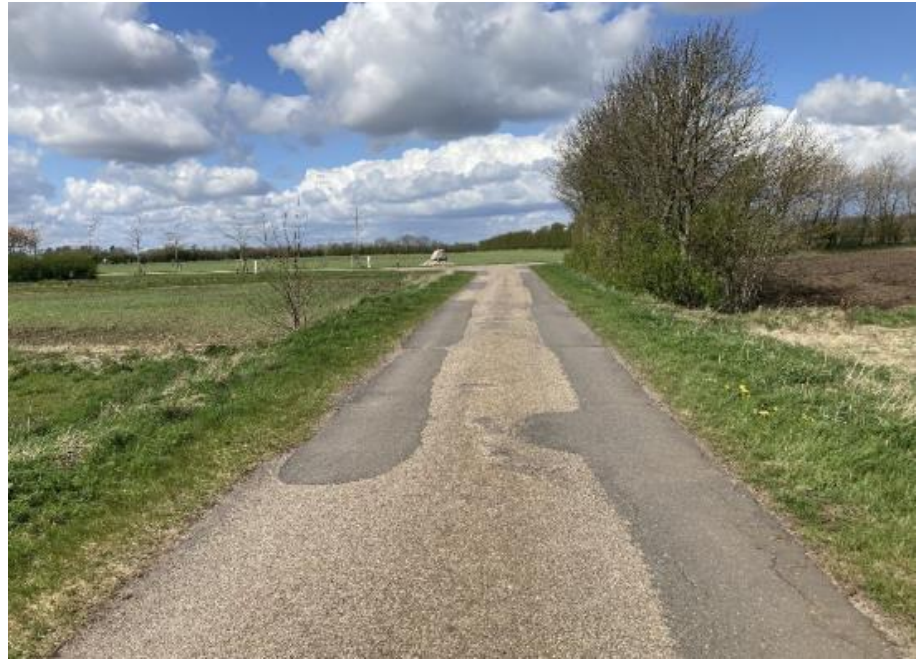
Figur 2: Oversigtsfoto set mod nord