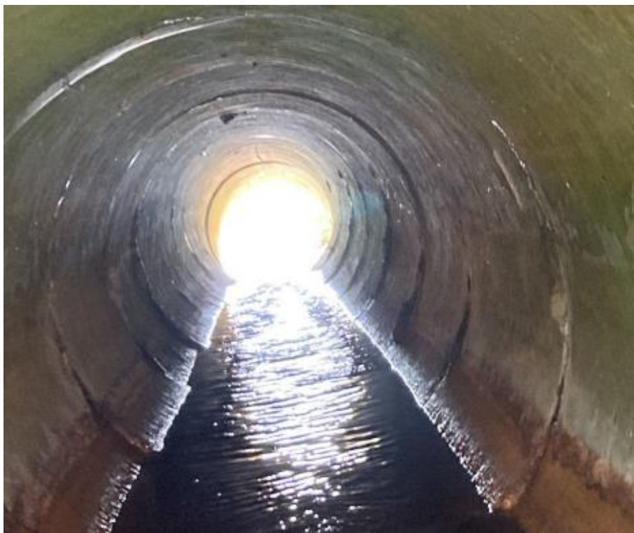
Figur 4: Bærende overbygning