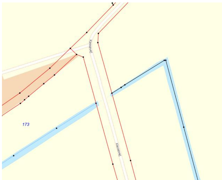
Figur 5: Lodsejerforhold med matrikelkort

Følgende matrikler vil blive berørt i forbindelse med arbejderne: