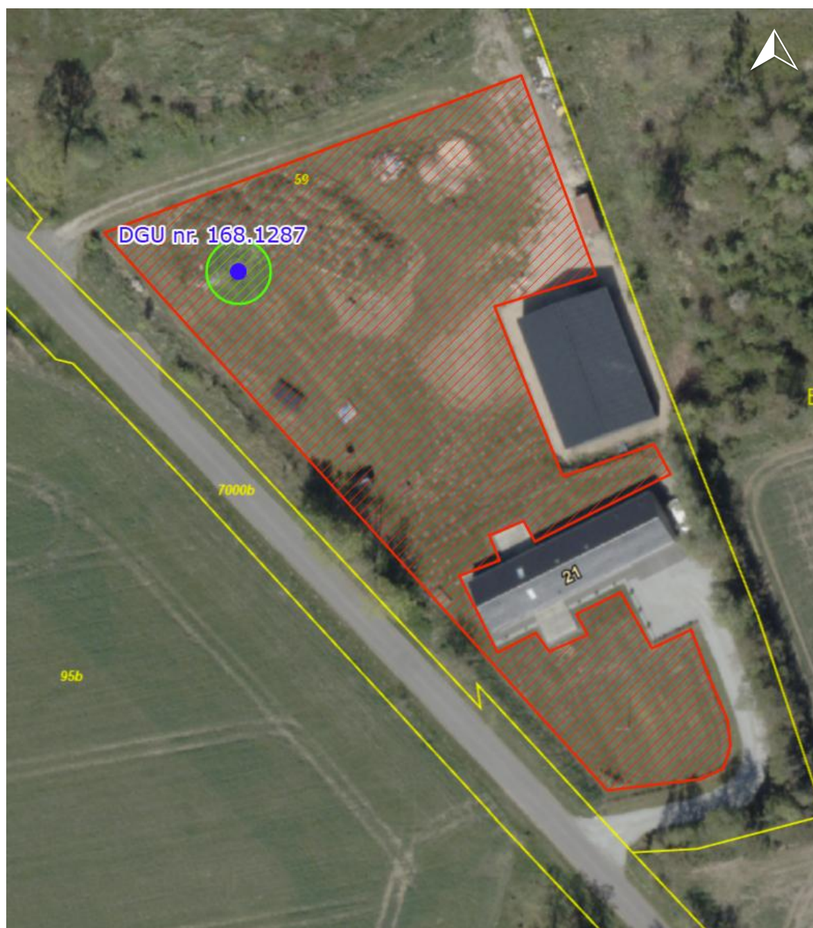
Figur 1: På luftfotoet placering af boring med DGU nr. 168.1287 angivet med blå prik og det vandede areal med rød skravering. Fredningsbælte er markeret med grøn ring.