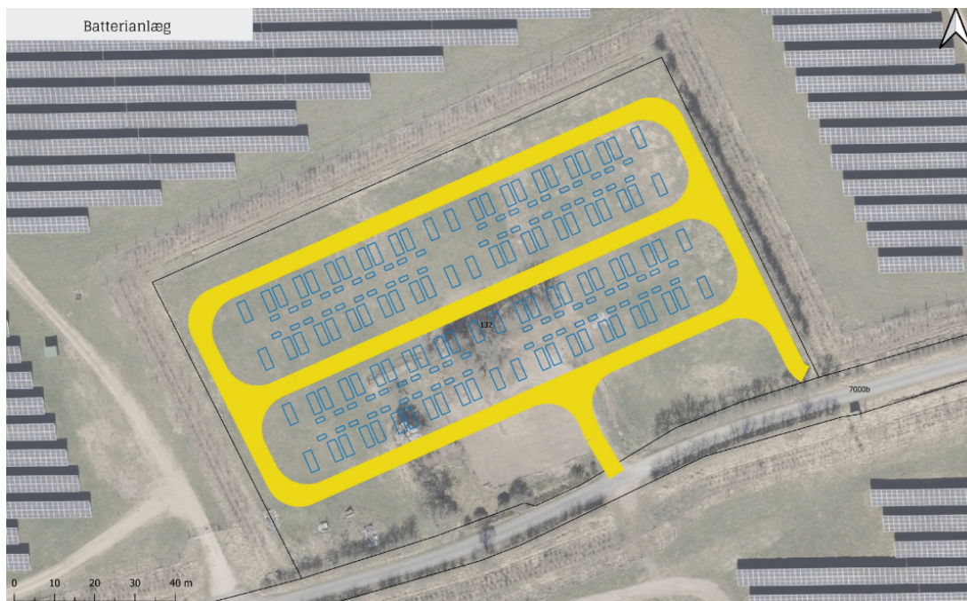
Principplan for batterianlægget

Ansøger oplyser at: Med den stigende udbygning af fluktuerende vedvarende energi i det danske og europæiske elnet er batterier blevet en nødvendighed for at undgå produktionsbegrænsning ved overskudsproduktion, når andelen af vedvarende energi i stigende grad overstiger efterspørgslen i løbet af dagen. Den stigende volatilitet i energiproduktionen medfører desuden en øget ubalance i elnettet, som netselskaberne kræver, at elproducenterne udbedrer og kompenserer for. Ansøger anser det derfor som nødvendigt at tilføje batterier til Kassø Solcellepark.