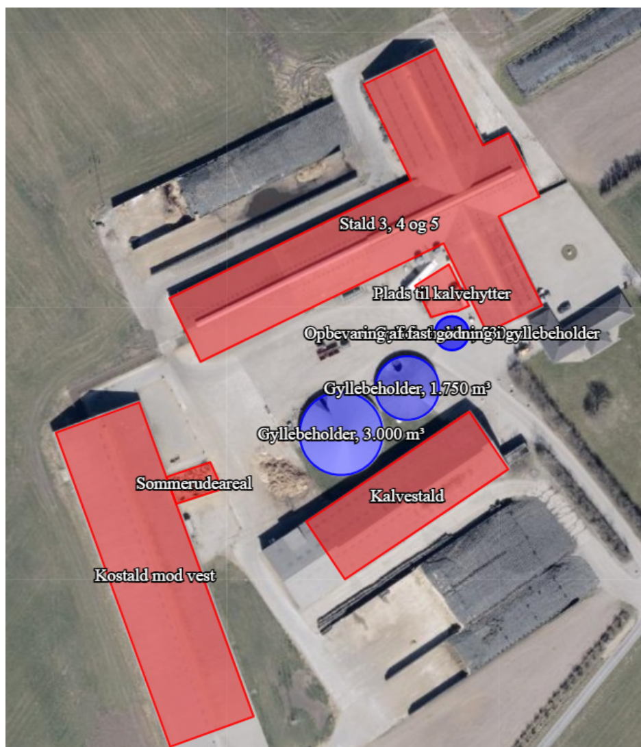
Figur 1. Oversigt over stalde og gødningsopbevaringsanlæg.

Det godkendte staldanlæg kan med denne tillægsgodkendelse udnyttes fuldt ud inden for grænserne for dyrevelfærdsreglerne. Se en oversigt over stalddene i Figur 1.