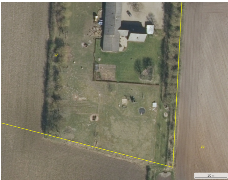
Figur 3. Luftfoto fra 2019, hvor det ses, at området er delvist inddraget som have, med trampolin og legetårn (NetGIS).

Efter 2010 og frem til nu er det delvist inddraget til have dog stadig med periodevis afgræsning. Arealet vurderes ikke at være omfattet af naturbeskyttelseslovens § 3.