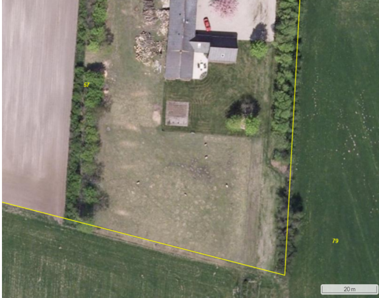
Figur 2. Luftfoto fra 2008, hvor det ses at arealet afgræsses muligvis med får (NetGIS).

Efter 2006 er det taget ud af markdriften, og har fortsat periodevis været afgræsset.