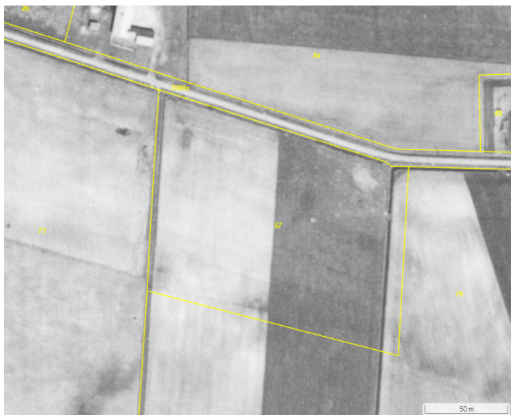
Figur 1. Luftfoto fra 1954, hvor det ses, at projektområdet drives som landbrugsareal (NetGIS).

Arealet har inden ejendommen blev bygget i 1957 været en del af et markareal. Herefter har det i perioder været afgræsset af husdyr og i perioder været genomlagt til markarealer.