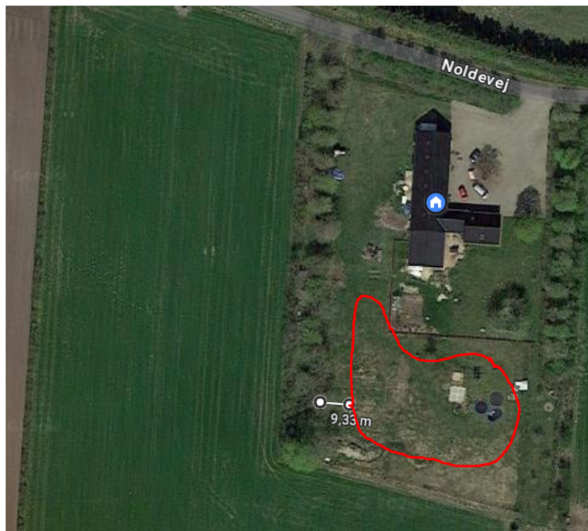
Figur 4. Kort fra ansøgningsmaterialet, der viser søens ca. placering.