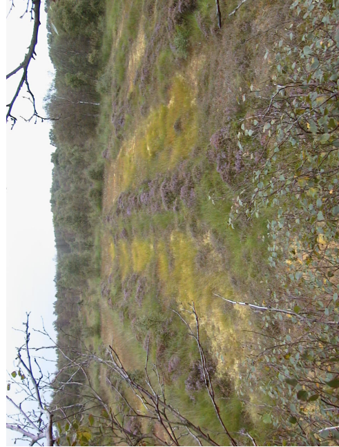
Der er tydelige "skærr" i mosen

Der er tydelige spor efter tørvegravning med små søer og lavninger. Sporene fortæller en spændende historie om hvordan mossen tidligere blev brugt til at udvinde tørv til brændsel.