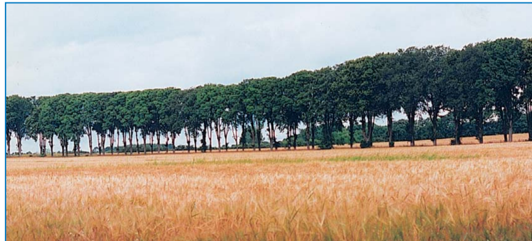
Ravnhøjalléen inden den blev angrebet af elmesyge