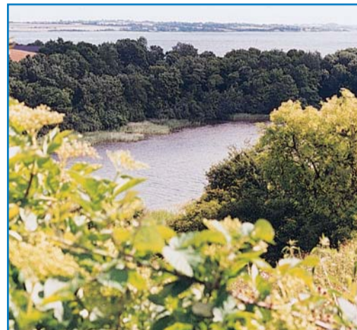
Udsigt over Skovsøen

Udgangspunktet for denne tur er opholdsarealet ved Naldtang. Turen går først langs nordsiden af den 11 hektar store skovsø, som er indtil 5 m dyb. Søen ligger meget smukt i bunden af den smalle og dybe tunneldal omgivet af op til 30 meter høje skrænter. Tidligere var det en vig med forbindelse til Als Fjord. Vigen blev benyttet som en naturlig havn, hvor en pælerække med bom beskyttede mod vendernes indtrængen. Senere er udløbet sandet til, og søen er blevet fersk. I starten har du ellekrat til alle sider, men godt 200 meter inde går stien opad, og der er en smuk udsigt til Skovsøen. Når Naldtangstien og Skovsøstien igen skilles, går denne tur mod syd forbi gården Vibekær, som er en af områdets tvillinggårde (se under udskiftningen). Længere fremme ad vejen er der en smuk udsigt ned over Varnæs Storemose - en gammel højmose der blev afvandet i 1960'erne og genskabt i 1992 (se afsnit om mosen). Fra asfalten kan man gore en afstikker ind til udsigtspunktet ved Stangled. Herfra har du et smuk kig ned til Skovsøen og ud over fjorden til Als. Det er et smukt sted at drikke den medbragte kaffe og der er opsat bord og bænke.