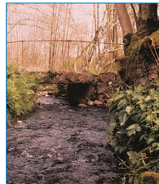
Knippelbro er bygget af en ung mand omkring 1890. Han havde slået fra sig med en knippel og blev derfor af lokalbefolkningen dømt til at bygge broen

Poststien byder på en dejlig, men også ret anstrengende tur. Stien har fået navn efter en postrute, der indtil slutningen af 1960'erne blev betjent af postbude, der til fods sørgede for posten fra Bovrup over Blåhøj til Naldtang. Turen starter fra P-pladsen mellem Varnæs og Blans, ca. 2 kilometer øst for Varnæs by. Her kan du vælge, om du vil følge den afmærkede rute mod Naldtang eller mod Blåskrog. Mod Naldtang fører stien forbi et flot udsigtspunkt, hvorfra du kan se ned over Varnæs Storemose (se afsnit om mosen), ud over de smukke marker med levende hegn og Als Fjord. Hvis du ikke ønsker at gå helt til Naldtang, kan du ca. 800 meter før Naldtang følge kysten til Blåbækkens udløb. Ruten går væk fra stranden op gennem de to hyggelige småbebyggelser Neder Blåskrog og Over Blåskrog. Maleren Christoffer Vilhelm Eckersberg blev født i 1783 i Neder Blåskrog. Ud for den gamle kro er der rejst en mindesten, og på hans barndomshjem i Blans sidder en mindetavle for "den danske malerkunsts fader". Senere på turen kommer du forbi en mindre stævningskov, hvor stammerne oprindeligt blev skåret ned ca. hvert 20. år. I dag ligger skovene dog mere urørt hen til gavn for vilde dyr og planter. Bemærk elmealléen, der fører op til et par af de karakteristiske tvillinggårde. Stien går over den lille stenbro, Knippelbro, ved Blåbækken og efter endnu en bakke er du tilbage ved turens udgangspunkt.