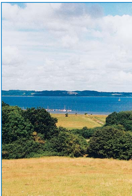
Udsigt fra Rævejberg

Den sidste del af turen går over marker og langs levende hegn, hvor der er rige muligheder for at plukke hyldeblomst, brombær og slåen.