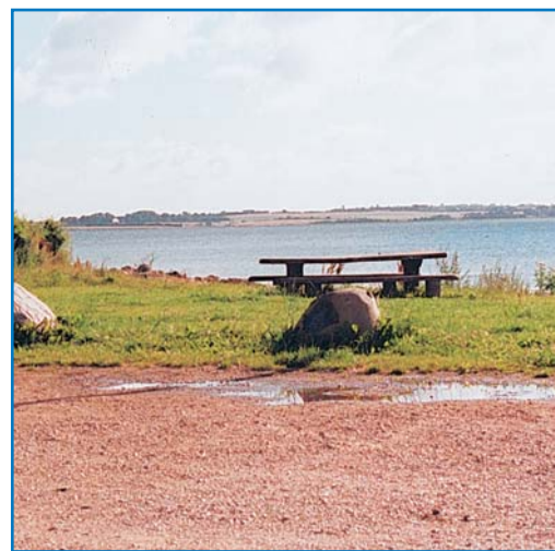
Opholdsarealet ved Naldtang

Her fra opholdsarealet, ved Naldtang lige ud til Als Fjord, starter den afmærkede tur. På den første strækning går turen langs med en lille bæk, der kommer inde fra Skovsøen. Turen, der følger skovstien på den nordlige side af søen (se Skovsøstien), er meget afvekslende med skiftende kig ned over søen og i skovbunden er der en meget varieret flora. Nyd skovens stilhed og læg mærke til hasselhegnet og de smukke vedbend, der klatrer op overalt. Fælles med Varnæs Hovedstien går ruten nu langs levende hegn og brombærranker ud til skrænten ned mod Als Fjord. Den næste del af turen følger skrænten, indtil den passerer et par af de karakteristiske gårde, der ligger sammen to og to (se afsnit om udskiftningen). Med en smuk udsigt over Als Fjord går turen tilbage til parkerings- og opholdsarealet ved Naldtang.