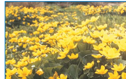
Landskabet omkring Blåbæk og Poststien er meget varieret. Langs Blåbæk findes enge og overdrev med en mangfoldighed af planter, bl.a. ranunkel og engkabeljeje. Det rige blomsterflor skyldes hovedsageligt kreaturgræsningen og manglende eller sparsom gødsning af disse arealer.