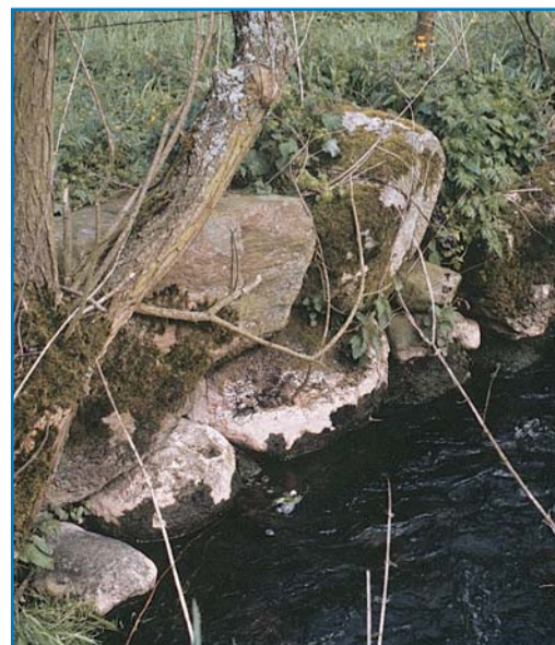
Stensætning ved Blåbækken