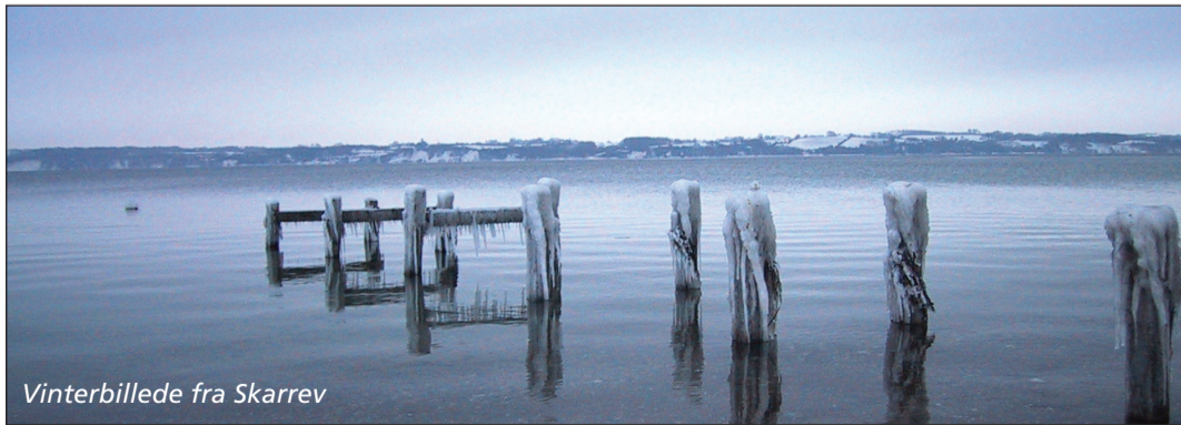
Vinterbillede fra Skarrev

Har du lyst til at opleve andre egne af Sønderjylland, kan du hente idéer på www.aabenraa.dk , www.naturstyrelsen.dk og www.udinaturen.dk . Folderen fås på biblioteker, turistkontorer og campingpladser i området.