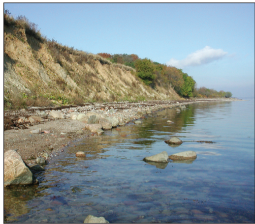
Kystskrænt ved Knudshoved

Ved mange af klintekysterne, hvor forstranden er præget af sten, kan man finde vandreblokke, der tydeligt dokumenterer isfremstødenes oprindelse fra den Botniske Bugt (østersøkvartsporfyrr) og Mellem- og Sydsverige (skånsk basalt og kinnediabas). Sådanne vandreblokke kan også ses i Stenparken på Kalvø.