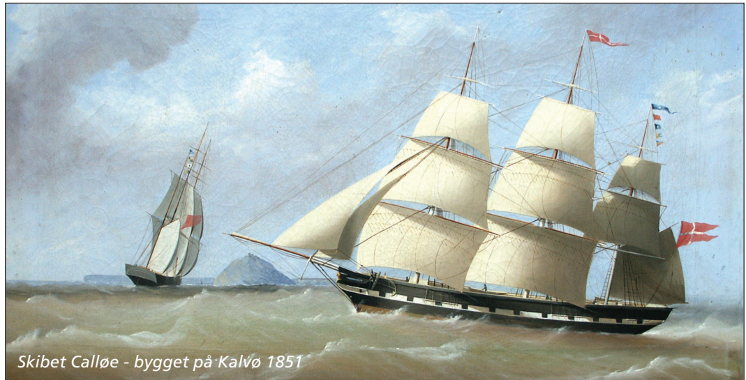
Skibet Calløe - bygget på Kalvø 1851

I løbet af 1700- og 1800-tallet fik søfart stor betydning på Løjt Land. I begyndelsen var det primært nærliggende farvande, man sejlede på, men i løbet af 1800-tallet tog flere og flere på langfart til Fjernøsten eller Sydamerika. Løjt Land blev kosmopolitisk – festdragten fik islæt af silke, og stuerne blev pyntet med souvenirs fra fjerne afkroge af verden. I dag udgør de såkaldte Kap-tajnsgårde et smukt vidensbyrd om Løjt Lands søfartsbaggrund. Kaptajnsgårdene på Løjt Land kan kendes på, at der ofte hænger et anker over døre eller porte samt på de søjleudmykkede hoveddørspartier. Efter krigen i 1864 sygnede skibsfarten hen. I 1880 kunne præsten således skrive, at hvor førhen 80% af konfirmanddrengene stak til søs, var tallet dalet til 20%.