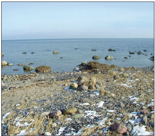
Stenet strand nord for Spramshuse