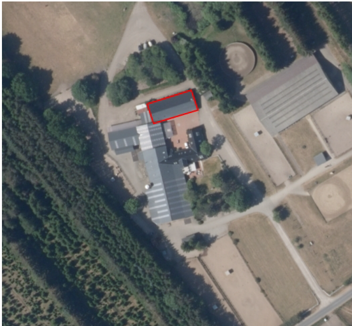
Situationsplan, rød ramme viser i hvilken bygning der skal være Bed & Breakfast